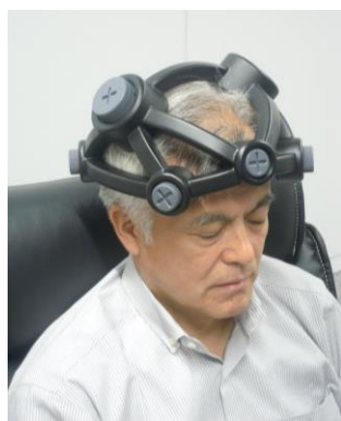
頭部への取り付け例