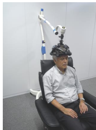
スタンドとの併用例