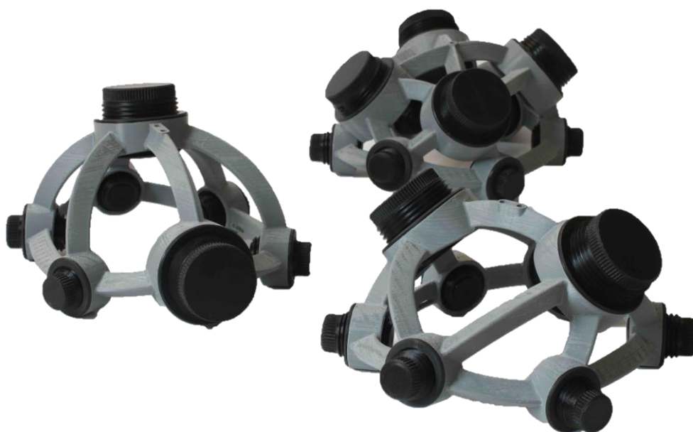
ヘッドギア 1.1 タイプ

経頭蓋静磁場刺激は、ネオジム磁石を用いた非侵襲的な経頭蓋磁場刺激です。頭部に磁石を固定するために専用のヘッドギアを Neurek 社(スペイン)が開発しました。本刺激は、脳活動および行動の基礎研究に用いられます。ヘッドギアは、刺激部位及び適用磁石により3種類のモデルが用意されています。磁石サイズは4種類からお選びいただくことができます。シャム刺激用磁石もセットになっていますので盲検試験が可能です。