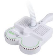
DM70BF-Cool エアークールドコイル