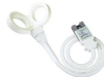
DM120BFV 120mmV型バタフライコイル