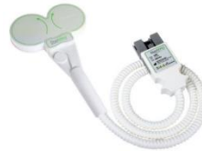
DM70BF 70mmバタフライコイル