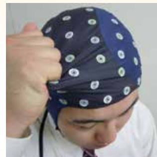
布地は引っ張りに強い2重構造