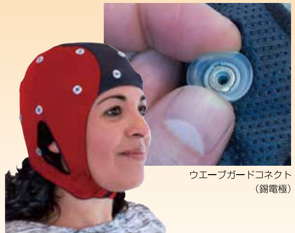
ウェーブガードコネクト (錫電極)