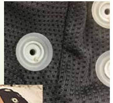
ウェーブガード (銀塩化銀電極)