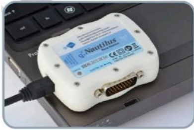
レシーバ トリガ信号入力に対応