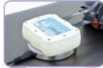
充電システム 充電器の上に置くだけで自動充電