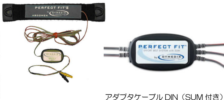
腹部センサⅡ Alice5DIN (成人用)